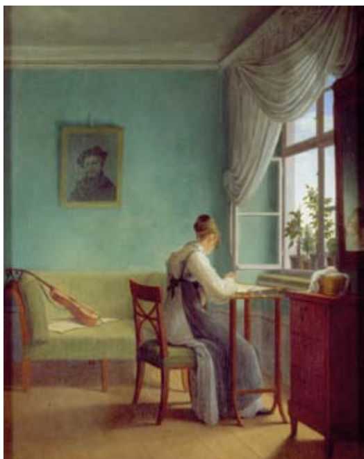
Georg Friedrich Kersting, Am Stickrahmen (Die Stickerin), 1827, Kunsthalle zu Kiel

Wohnen in der Kunst. Vom Interieurbild der Romantik zum Wohndesign der Zukunft