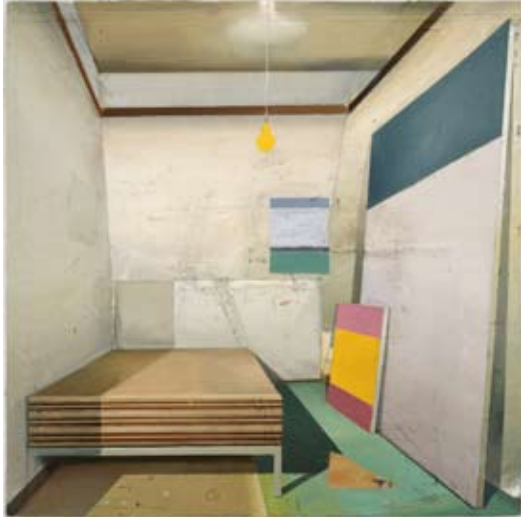
Matthias Weischer, Gelbe Lampe, 2004, Privatsammlung, Frankfurt am Main, © courtesy Galerie EIGEN + ART Leipzig/Berlin / VG Bild-Kunst, Bonn 2008/Foto: Uwe Walter

Wohnen in der Kunst. Vom Interieurbild der Romantik zum Wohndesign der Zukunft