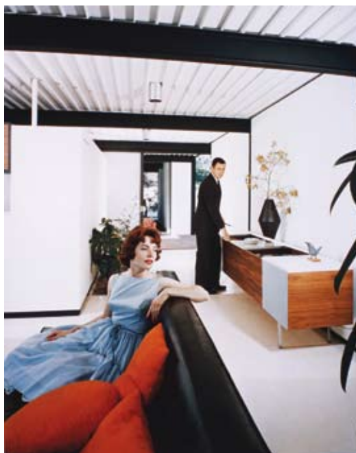
Koenig, Pierre and Shulman, Julius, [Case Study House No. 21 (Los Angeles, Calif.)], 1958, © J. Paul Getty Trust. Julius Shulman Photography Archive.